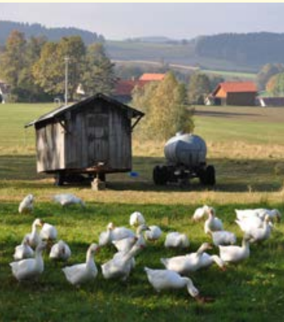
Foto oben sowie die Titelseite: Herbst in der Oberpfalz. Das Titelbild zeigt den Ort Roggenstein mit der St. Erhard Kirche.