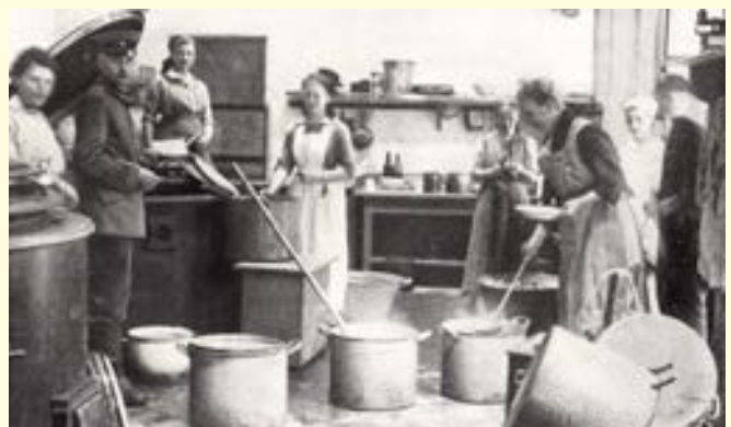
„Küche des Soldatenheimes Torgau“ aus: Chronik „30 Jahre Deutsch-Evangelischer Frauenbund“