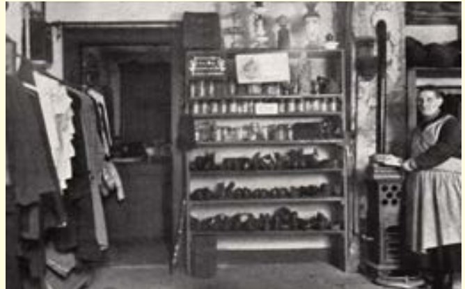
„Brockensammlung in Hildesheim“ aus: Chronik „30 Jahre Deutsch-Evangelischer Frauenbund“