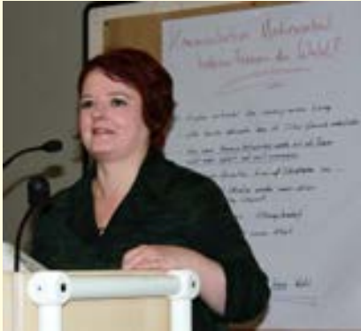
Verena Osgyan, MdL und Synodale

Vortrag von Verena Osgyan, Bündnis 90/ Die Grünen im Bayerischen Landtag, an- lässlich der DEF - Landesverbandstagung am 2. Juli 2014 in Augsburg